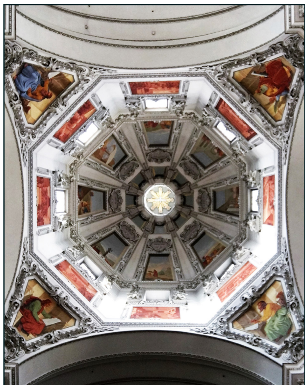
图一：一个美丽的建筑图像。