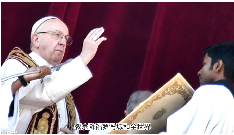
教宗降福罗马城和全世界