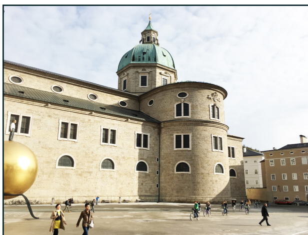
图二：奥地利萨尔茨堡主教座堂外观。